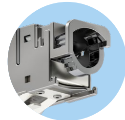
Kategorie 6A 360° Schirmkontaktierung

Installation ganz leicht: Wie schon bei den Modulen der MC45 Pro Serie gewohnt, ist auch hier die Montage ein Kinderspiel. Adern einführen, Kabel fixieren und verpressen. Leichter geht es kaum. Und alles ohne Spezialwerkzeug.