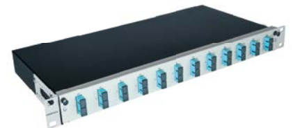
GigaLine® 19" Box, 1 HE, ausziehbar