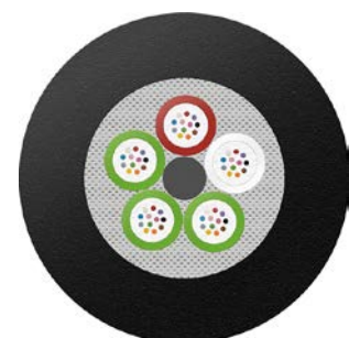
GigaLine® - Glasfaserkabel mit verseilter Bündelader