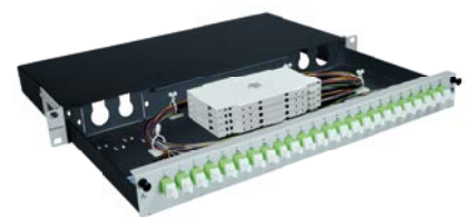
GigaLine® 19" Box, 1 HE, ausziehbar