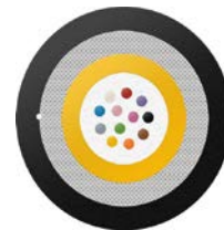
GigaLine® - Glasfaserkabel mit zentraler Bündelader